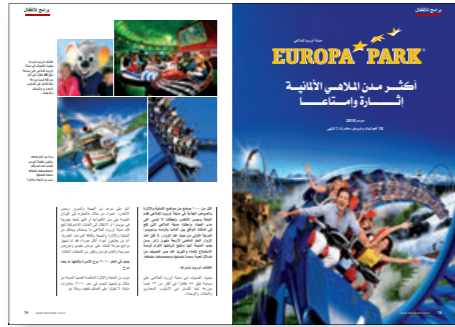
2/1 Seite 2.900,- €