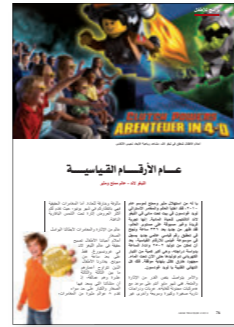
1/1 Seite 1.900,- €