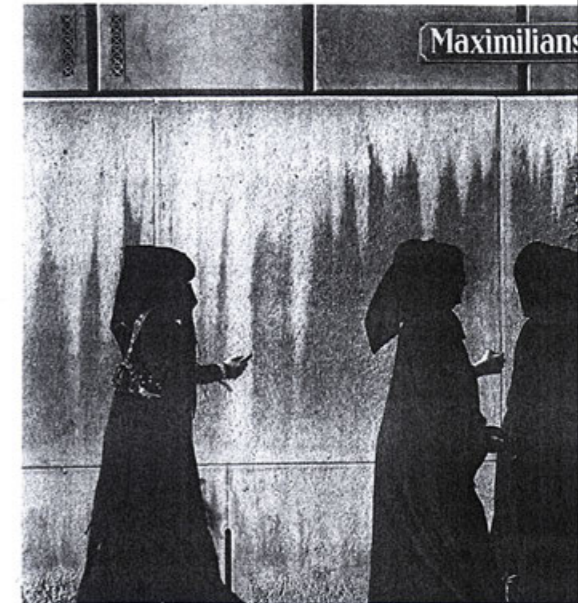
Verschleierte Besucher aus arabischen Staaten gehören im Sommer zum Mü

Die lokalen Kontakte zahlen sich aus, abgesehen von den Reizen, die München in den Augen der weitgereisten Gäste besonders attraktiv machen. Neben den Sehenswürdigkeiten vermitteln die vom großstädtischen Berlin oder Hamburg aus ja gern belächelte adrette Sauberkeit und die überschaubaren Dimensionen offenbar ein angenehmes Gefühl der Sicherheit – mit dem man sich in aller Ruhe