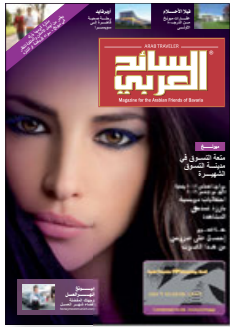
Titel 1/1 Seite 4.200,- €

Mit den Advertorial Präsentation bietet Ihnen ARAB TRAVELER die Gelegenheit, Ihr Produkt oder Dienstleistung in einem adäquaten Umfeld zu präsentieren.