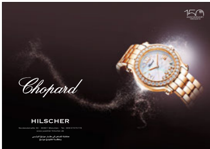
2/1 Seite (Doppelseite)

Wenn Sie eine Anzeige im eigenen Layout schalten möchten, ist dies natürlich auch möglich. Vorzugsplatzierungen auf Anfrage (Umschlagseiten und Rücktitel)